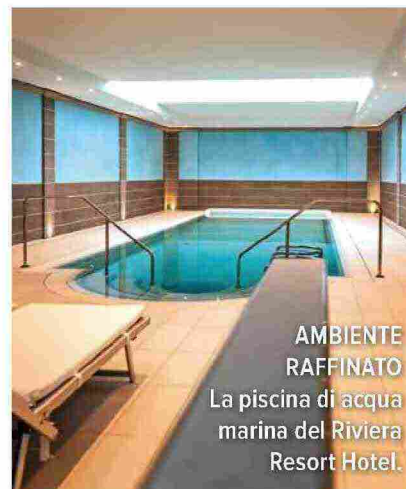
AMBIENTE RAFFINATO La piscina di acqua marina del Riviera Resort Hotel.

I trattamenti. Se ami le coccole, al Thalasso Riviera Resort ti attende un massaggio detox effetto nuvola: avvolge il corpo in una mousse calda a base di kombu e altre alghe bretoni. Un modo dolce per levigare la pelle “a buccia d’arancia” e arricchirla di minerali e vitamine. Per il viso, merita l’Excel Therapy 02, soin Germaine de Capuccini che ossigena l’epidermide ( rivieraresorthotel.it ).