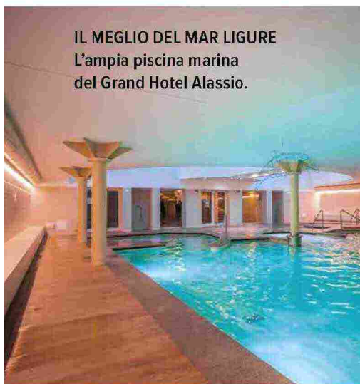
IL MEGLIO DEL MAR LIGURE L’ampia piscina marina del Grand Hotel Alassio.

Sia l’hotel sia la spiaggia privata su cui si adagia mostrano un animo green, che privilegia materiali naturali come il legno e la pietra d’Istria. Un esempio di sostenibilità, testimoniato dalla certificazione ISO 13009.